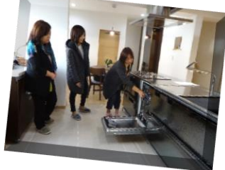
↑食器洗い機の使い方を教えて頂きました。