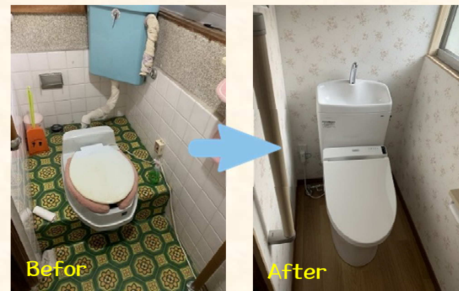
和式トイレを洋式トイレに！！