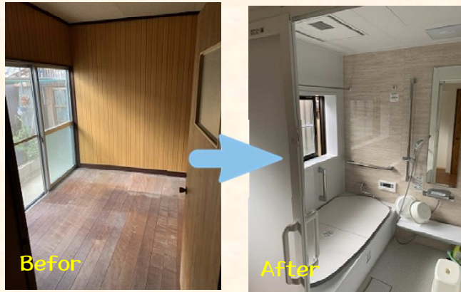
板の間スペースがなんとお風呂場に！！

板の間のスペースだった場所にお風呂場を移動し、お風呂だった場所をフローリングスペースに変更しました。 大掛かりな工事となりましたが、どちらも劇的に変化し、広く快適な空間になりました。