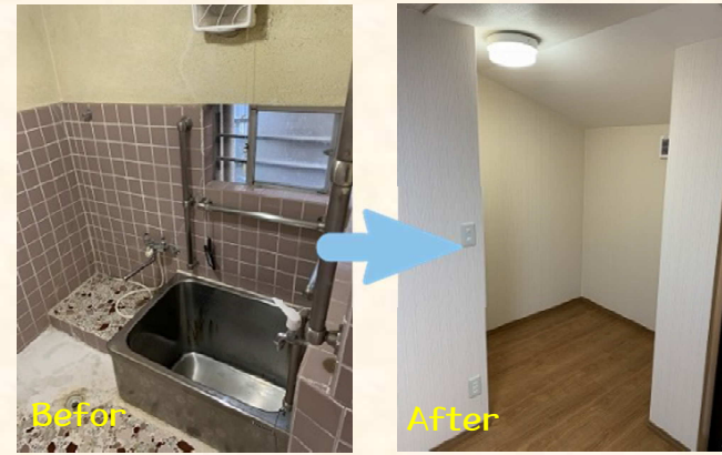
お風呂場がフローリングスペースに！！