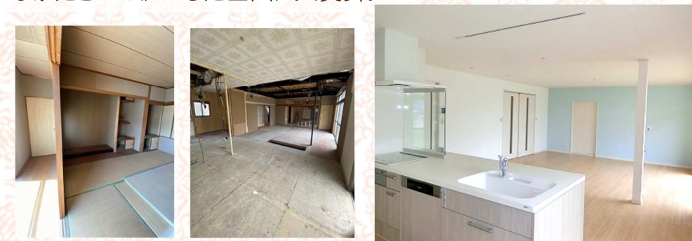
↓キッチンからリビング

キッチン横には、パントリーを設け、食品ストックやインターネット設備など細々した物を置くことができ、とても便利です。