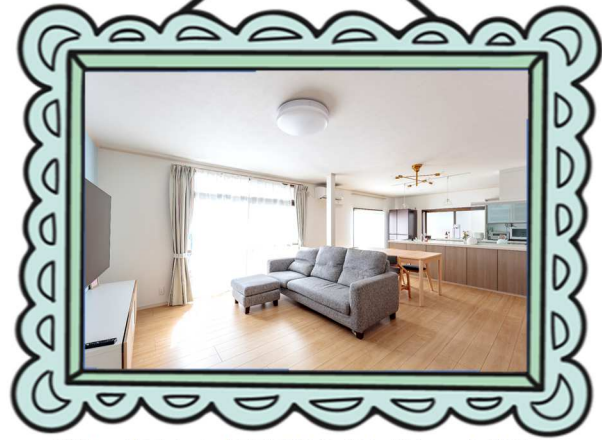
明るい広々とした空間に生まれ変わったLDK。