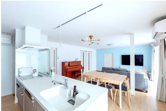
水色のアクセントクロスは、奥さまのお気に入り。

今回は、昨年8月号のフルリノベーションでご紹介したM様邸を生活のご様子など再び、取材させていただきました！